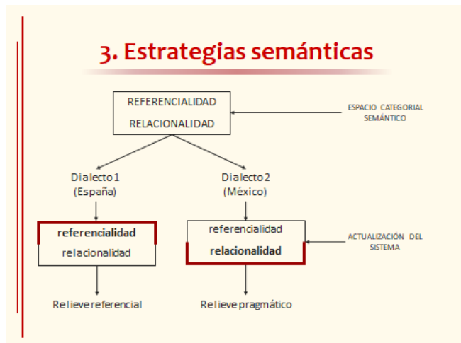
Figura 2. Relieve referencial frente a relieve relacional en las variantes española y peninsular del español, según Company (2017: s.f.) Imagen de Company.

Company (2017), por su parte, destaca un predominio de valores relacionales de la lengua en México, es decir, un uso de elementos sintácticos que sirven para marcar la forma como se relacionan los interlocutores, mientras que en España predominan los valores referenciales o descriptivos del mundo.